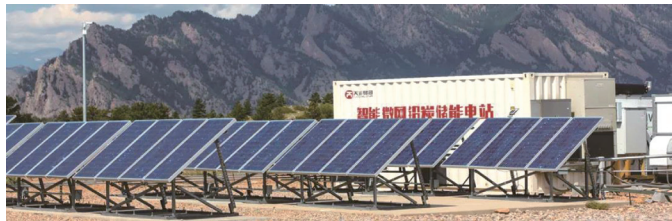
高性能鉛炭電池儲能項目