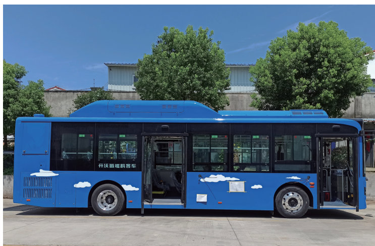
裝載天能氫燃料電池系統城市客車

今年來，公司燃料電池市場化應用進程加快。在今年三月舉辦的北方國際自行車電動車展覽會期間，天能與雅迪集團圍繞氫能電車達成戰略合作協議，雙方將攜手推進氫能電池研究，正式發佈氫能源電動自行車，共同推進氫能源電動自行車商業化進程。於二零二一年四月，由天能自主研發的高性能TNFC-LP2020型號水冷電堆產品，正式匹配德燃動力的FCV6座版觀光車，並在中國燃料電池汽車示範應用城市群的牽頭城市——嘉興進行示範運營。二零二一年六月，工信部公佈了第345批《道路機動車輛生產企業及產品》名單，裝載著天能T60-C氫燃料電池系統的南京金龍NJL6106產品型號的燃料電池城市客車上榜。這標誌著天能氫燃料電池系統成功進入了燃料電池汽車應用領域。公司也正積極接洽其他領域如特種動力、乘用車等廠商，謀劃深度合作。