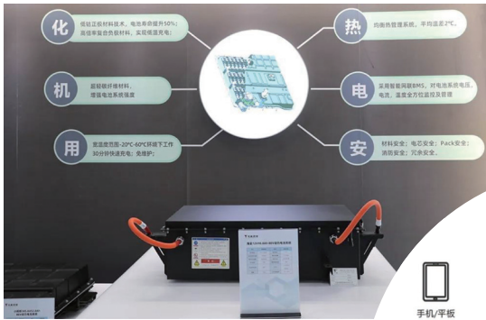
新能源汽車鋰離子動力電池

天能多方位佈局新能源產品。公司鋰離子電池產品適用於純電動汽車和混合動力汽車。集團現已與海全、鴻日、麗馳等新能源汽車廠商達成戰略合作關係，為其供應鋰離子動力電池產品。在智慧能源方面，集團鋰離子儲能電池目前主要應用於通信基站、用戶側削峰填谷、離網電站、微電網、UPS等領域，並獨立研發儲能機櫃系統。天能還推出多款面對個人用戶的移動儲能電源產品，適配戶外用電、各類急需用電的生活與生產場景。在消費鋰電池方面，天能產品以其優越性能和高品質，在兒童車、玩具、電動工具、電子影音等領域應用廣泛。