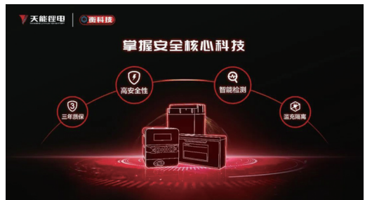
「衡科技」系列超能錳鐵鋰電池