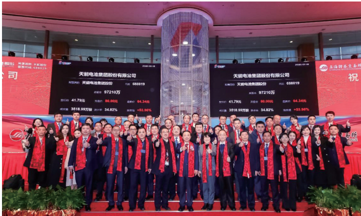
本公司之控股子公司天能電池集團股份有限公司（證券代碼688819.SH）在上海證券交易所科創板掛牌上市。

依托近年來穩健增長的業績表現及市場發展潛力，天能獲得資本市場進一步認可。報告期內，本公司被納入恒生滬深港智能及電動車指數，成為唯一一家入選該指數的港股電池行業上市公司。二零二一年一月，本公司之控股子公司天能電池集團股份有限公司（證券代碼688819.SH，「天能股份」）在上海證券交易所科創板掛牌上市。天能股份於二零二一年六月被納入全球第二大指數編制公司富時編制的中國A400指數，並於同月成為首批中證指數有限公司編制的科創創業50指數（「雙創50」）成分股之一。