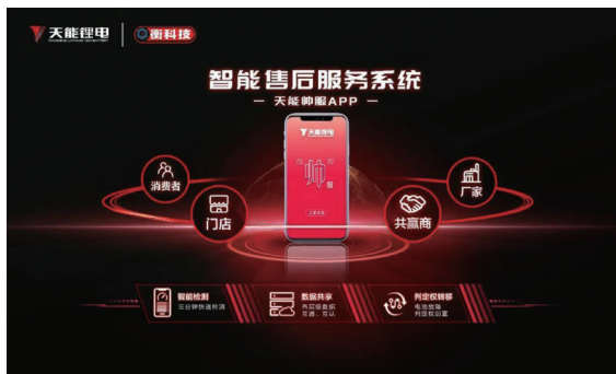
天能自主開發電池智能檢測軟件——「天能帥服」