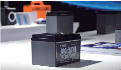
天能推出首個運用「納米碳金」與「鏽晶合金」新型材料的高端環保電池

天能高度重視技術研發工作，現已形成「總部國際研究院+事業部技術中心+生產基地技術部」三級研發架構。本集團植根鉛蓄電池業務，加速發展鋰電池業務，穩步推進燃料電池產業化，持續探索鈉離子電池、固態電池等新型電池技術；致力於新技術、新工藝、新材料的研發和使用，滿足多元市場和客戶的需求，打造公司高質量發展的核心競爭力。報告期內，天能推出首個運用「納米碳金」與「鏽晶合金」新型材料的高端環保電池、「衡科技」系列超能錳鐵鋰電池、鋰離子移動儲能電源產品及五大全新系列汽車起動啟停電池。同時，公司與雅迪集團（證券代碼 1585.HK）聯合發佈了氫能源電動自行車，裝載著天能 T60-C 氫燃料電池系統的南京金龍城市客車也登上了中華人民共和國工業和信息化部（「工信部」）第 345 批《道路機動車輛生產企業及產品》名單。